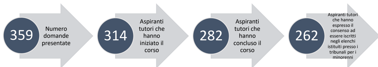
Figura 1 - Numero degli aspiranti tutori volontari selezionati per partecipare al corso, che lo hanno iniziato e concluso con successo e che hanno espresso il consenso a essere iscritti negli elenchi istituiti presso i tribunali per i minorenni: valori assoluti II semestre 2024.

Come si evince dalla Figura 2, al 31 dicembre 2024 gli aspiranti tutori volontari che hanno iniziato il corso di formazione sono stati complessivamente 5.7285. Di questi, 5.272 hanno portato a termine con successo il percorso formativo. Tra coloro che hanno concluso il corso, poi, 4.339 (circa l'82%) hanno espresso il consenso formale all'inserimento negli elenchi istituiti presso i tribunali per i minorenni, confermando il dato del primo semestre 2024.